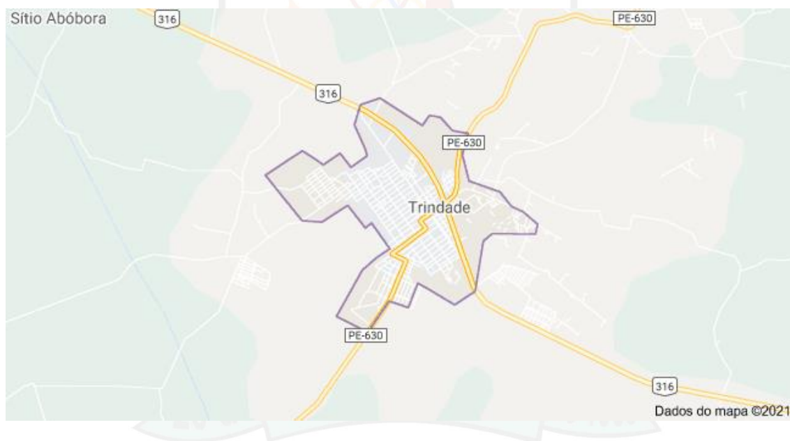
Figura 1 – Mapa do Município de Trindade.

A economia municipal concentra-se em grande parte na extração, produção e comercialização da gipsita e produtos oriundos da mesma, sendo exportada para todas as regiões do Brasil, e alguns países de mundo, seja como rocha bruta, calcinado, placas ou bloquetes, sendo usado também na fabricação de cimento, fertilizante, na construção civil e na produção de obras de arte. É responsável por 95% da produção nacional de gesso, com uma produção anual de 2,5 milhões de toneladas. Além da cadeia produtiva do gesso, setores como comércio, agricultura familiar (pequenas proporções) e serviços também contribuem para a economia local.